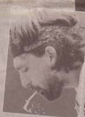
1998 Der Piraten-Goran. Unrasiert und wieder mit richtig langer Mähne. Ein Piratentuch fesselt seine Haare. Ein ziemlich wilder Typ