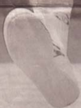
Der Superbleed tr... ne richt... trumpft to... der Burs...