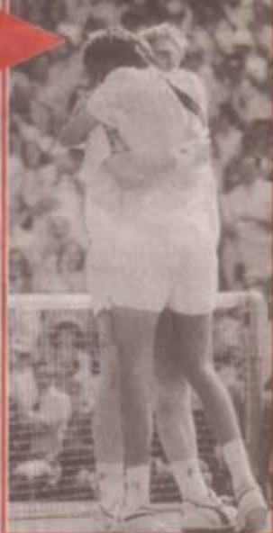
7.7.1991, 17.42 Uhr: Stich ist Wimbledon sieger. Becker umarmt ihn am Netz